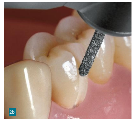
Abb. 2a und 2b: Das längere Instrument 4ZR eignet sich auch zum flächigen Abschleifen von Fragmenten von vollkeramischen Kronen.