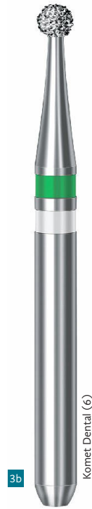
Abb. 3a und 3b: Die Trepanation von Vollkeramikronen ist sehr gut mit der Kugel ZR6801.314.014 zu bewerkstelligen.

Adaptationsprobleme ein mit teilweise langwierigen Folgen (z.B. Kiefergelenksbeschwerden). Hinzu kommt die Abrasion, die das harte Material auf einem möglicherweise weicheren Antagonisten verursacht. Die Anfertigung einer nächtlichen Schutzschiene bei Verwendung von z.B. e.max, Zirkon etc. ist bei uns eine conditio sine qua non . Bei der standardmäßigen Verwendung von metallkeramischen Verblendkronen war dies nicht unbedingt notwendig – ganz zu schweigen von den TK-Gold-Zeiten.